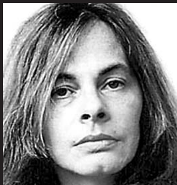
Cristina Peri Rossi