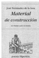
Fernández de la Sota publica su último poemario