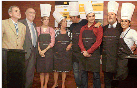
En el Barceló Nervión se inauguró 'Cocina vista'