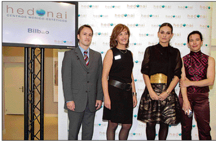
Hdonai, nuevo centro médico-estético