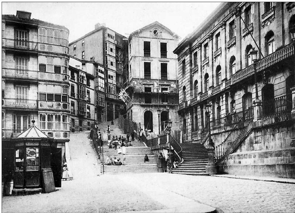
El Instituto Vizcaino se ubicaba en la actual plaza Miguel de Unamuno

Allí se formaron las generaciones de bilbainos que lideraron la vida económica, social y cultural de la Villa a comienzos del siglo XX