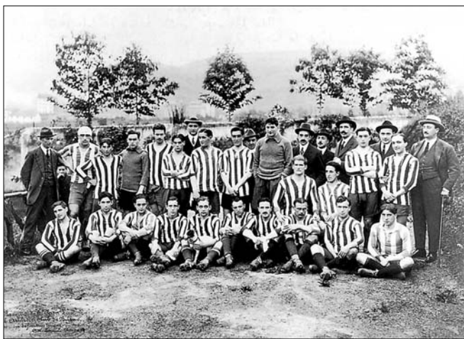
Fotografía histórica del Athletic en Jolaseta

"Pichichi" presente en los comentarios sobre goleadas