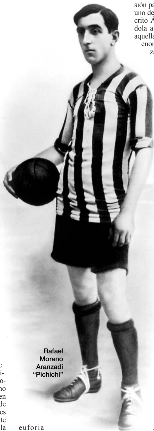
Rafael Moreno Aranzadi "Pichichi"