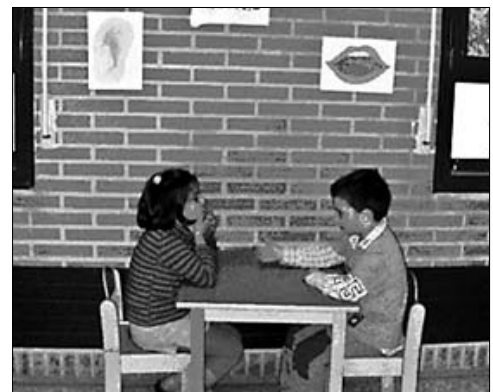
Dos alumnos en el "Adostoki" (lugar para el acuerdo)

El centro lleva alrededor de quince años trabajando la convivencia, formando primero al profesorado y después a los alumnos. La formación de los docentes corre a cargo de expertos universitarios en temas como acción reparadora o mediación. Todos los conocimientos adquiridos, como pueden ser el autocontrol, la solución de conflictos o la aceptación de las normas, son traspassados al alumno para que los lleve a cabo de una manera activa. Por ejemplo, el no cumplir una norma no se soluciona con copiar 100 veces una frase o palabra, hoy en día se utilizan