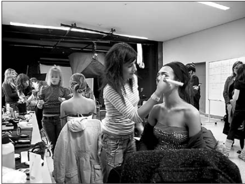
Curso de maquillaje impartido por la London College of Fashion