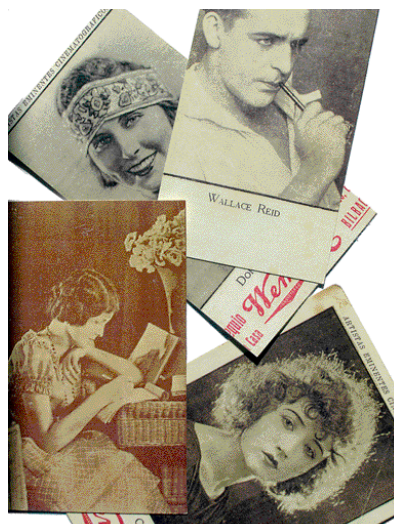
Cromos varios de la colección Artistas eminentes cinematográficos