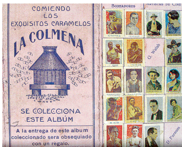
Álbum de cromos de la fábrica de caramelos y bombones "La Colmena"

Disponían de cuatro dobles caras que se ocupaban con cromos de jugadores del Athletic, de la Real, del Madrid, del Sevilla, del Barcelona y del Europa. Eran los tiempos en que Carmelo, Acedo y Aguirrezábal, entre otros, formaban la alineación de nuestro primer equipo. Plana y media eran ocupadas por boxeadores como Uzkudun, Charpentier, Girones, Tunney, Quintana y Mascart. Los artistas de cine completaban el resto.