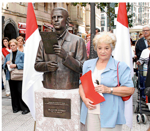
La Fundación Blas de Otero ha cumplido su octavo aniversario