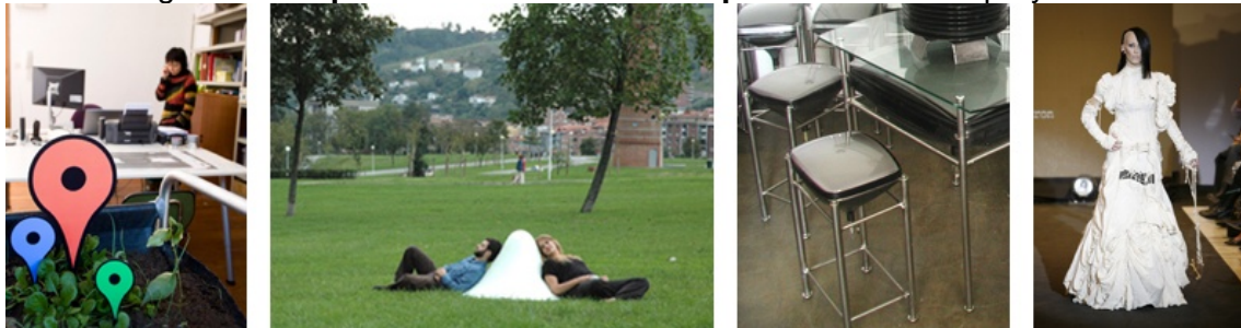
IDEATOMICS / Txabi Zabala Diseño de Producto / Recrea2 / SinPatrón.